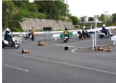
二輪車安全運転教室