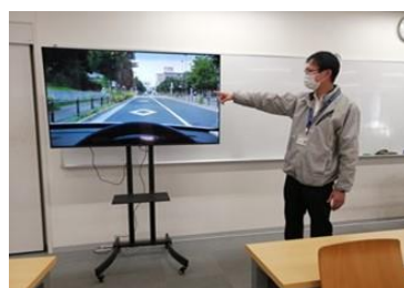
企業向け安全講習